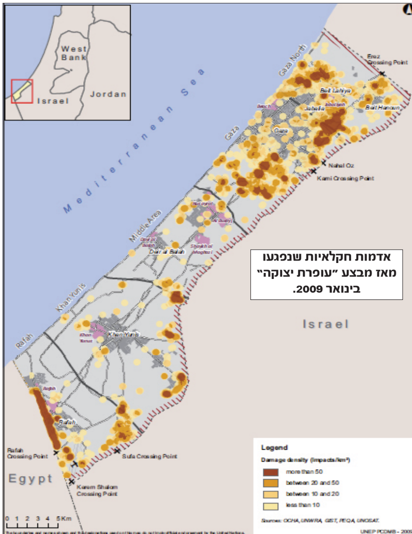
אדמות חקלאיות שנפגעו מאז מבצע "עופרת יצוקה" בינואר 2009.

ארגון המזון והחקלאות של האו"ם (FAO) אתר: www.fao.org משרד בגדה המערבית וברצועת עזה: רחוב הר הזיתים 25, שכונת שיחי ג'יראח, ת.ד. 22246 טלפון: +972 (0)2 532 1950 פקס: +972 (0)2 540 0027